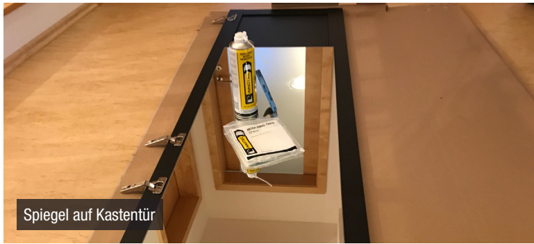
Spiegel auf Kastentür